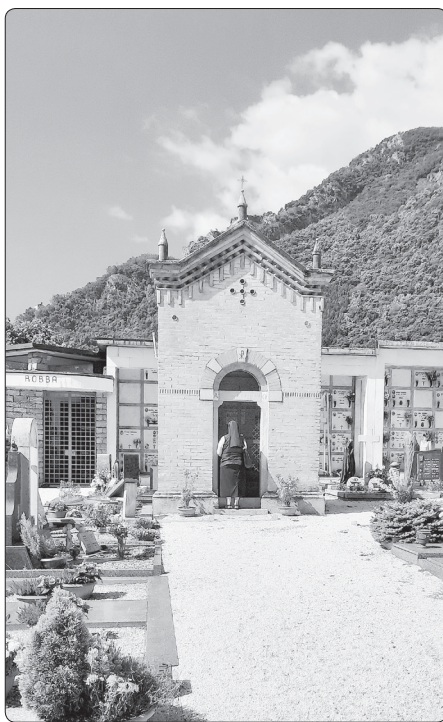
Hrobka kněží na hřbitově v Dongu