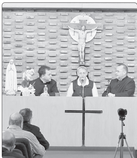
Svědectví při fraternitě

věřící k obrácení, modlitbě a postu, jakož i k hlásání evangelia. Vybavuje se mi také svědectví staříckého irského misionáře, působícího na Fidži v Oceánii. Než se dostavil na duchovní cvičení, navštívil svou rodnou vlast a příbuzné. Jedna z jeho příbuzných, řádová sestra, bydlící v jeho rodném městě Corku, má ve zvyku v centru města chodit často na mše svaté. Když tam ale našla pohozených 39 hostií, přestala je pak už počítat. Kněz si povzdechl: „ A to je moje milované katolické Irsko. To je důsledek podávání Eucharistie