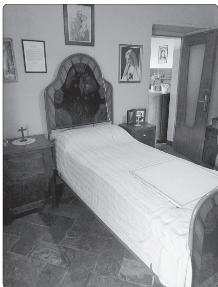
Rodná světnička vizionáře v Dongu

Naše cesta do Itálie po třech letech začala u hrobu zesnulého Dona Stefana Gobbiho na hřbitově ve městě Dongo, ležícím na břehu jezera Como na severu Itálie. Cesta přes švýcarské Alpy by-