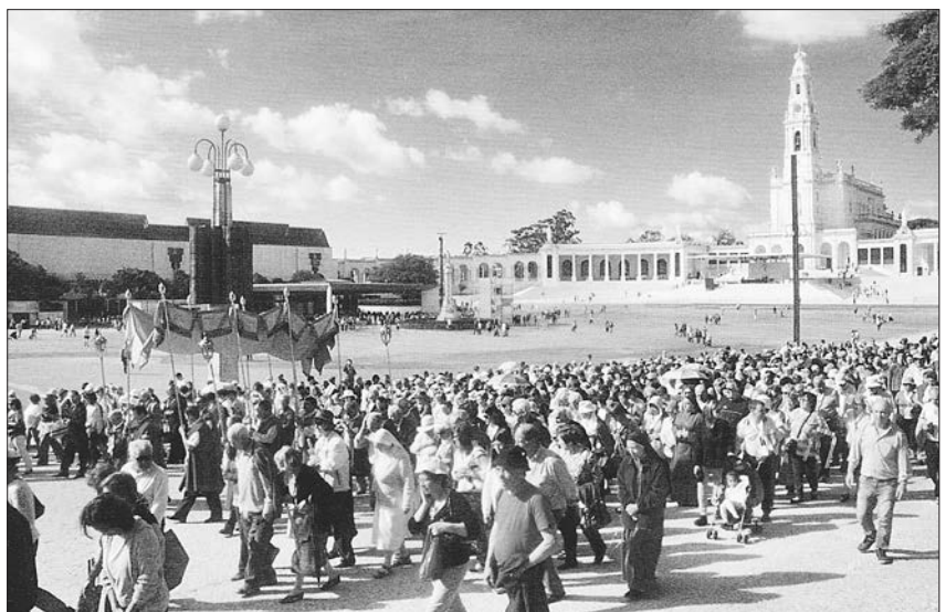
Panna Maria hovoří o nutnosti modlitby, nabízí růženec a varuje před hrozbou morální degradace

Svatý Jan Pavel II. píše: „Když v mnoha zemích padly ideologie,