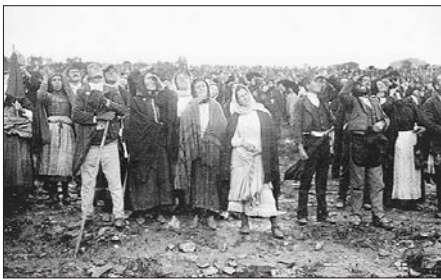
Všichni byli úplně promoklí a stáli v blátě v očekávání předpovězeného zázraku

by to bylo obrovské ohnivé kolo a blížilo se k zemi, vrhající na zemi, stromy, skály i lidi paprsky tak zázračného, silného, barevného světla, jaké nikdo nikdy dosud neviděl. Slunce se třikrát zastavilo a třikrát se ten fantastický tanec znovu opakoval. V jistou chvíli slunce začalo padat a klikatým pohybem se blížilo k zemi. Vypadalo to tehdy, že nastává kosmická katastrofa srážky slunce se zemí. V té chvíli celý shromážděný dav padl na kolena. Lidé šokováni křičeli, prosili o milosrdenství a litovali hříchů. Někteří se hlasitě vyznávali ze svých hříchů, uvažující, že to je konec světa. Lidé vkleče plakali a modlili se. Ten neobvyklý jev trval deset minut. V tom krátkém čase byla země, která se změnila v důsledku prudkého deště v úplně bahno, zcela osušena a do nitě promáčené oděvy shromážděných lidí