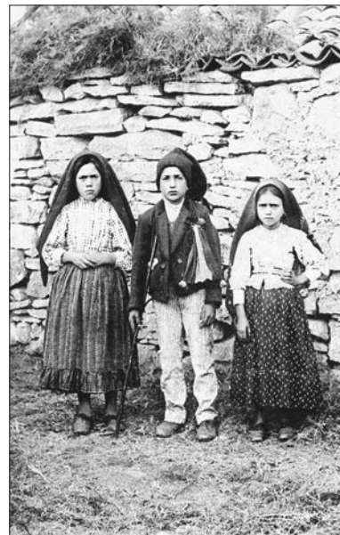
Fatimští vizionáři Lucie, František a Hyacinta