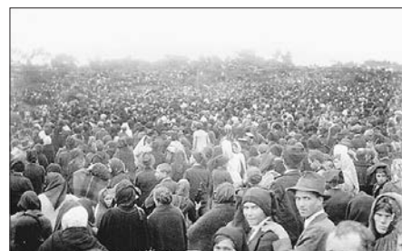
Mezi shromážděnými byli nejen lidé velmi prostí, ale i vědci, novináři a ateisté stavějící se ke zjevením velice skepticky