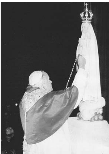
Jan Pavel II. věnuje Panně Marii růženec jakožto vótum za záchranu života při atentátu uskutečněném na náměstí Svatého Petra v Římě (Fatima, rok 1982)

Když se zjevila portugalským dětem, předpověděla Matka Boží veliké znamení na závěr zjevení ve Fatimě. Řekla, že udělá zázrak, aby všichni uvěřili.