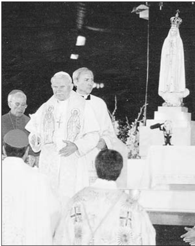
Matka Boží ve Fatimě připomenula, že největší hrozbou pro lidstvo je odmítnutí Boha a jeho práv

Sluha Boží arcibiskup Fulton J. Sheen potvrdil, že k tomu, abychom mohli plně porozumět obsahu fatimského poselství, je třeba si uvědomit, že Matka Boží se objevila v obci s muslimským názvem. Takto nám Panna Maria touží objasnit, že pro návrat míru je nutné také obrácení muslimů. Proto je naší povinností modlit se za jejich obrácení a tam, kde to je možné, dělit se s nimi o evangelium, o radostnou zvěst o spáse, kterou nám dává Ježíš Kristus.